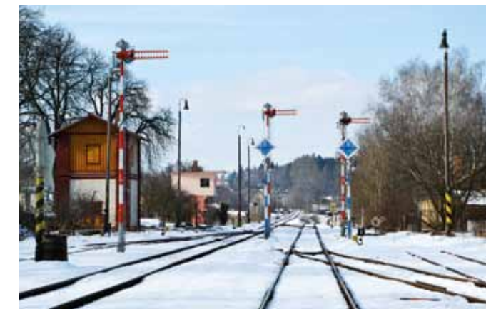
Widok zwrotnicy na stacji roztockiej/jilemnickiej. W głębi wieża zwrotnicza St2