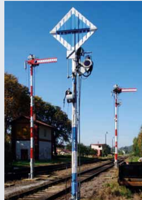
Semafor grupujący Se1. W głębi semafor odjazdowy i wieża ciśnień