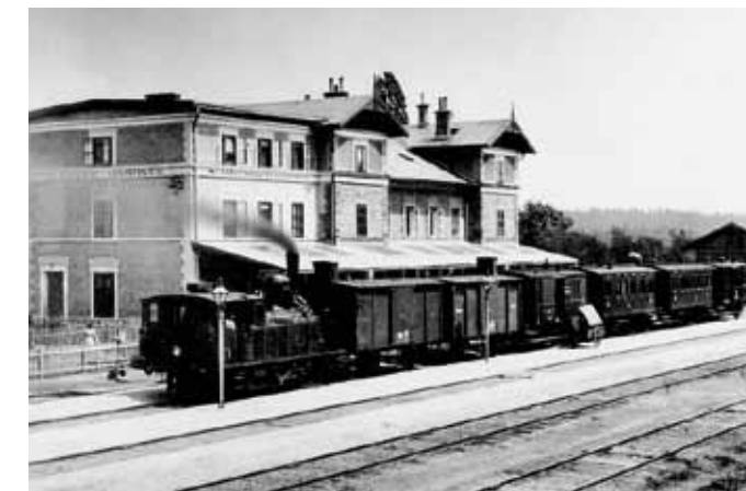
Pociąg ciągnięty przez lokomotyw! 313.4 przed budynkiem ekspedycyjnym około roku 1910

Przy dźwigu na roztockiej/jilemnickiej głowicy znajduje się jama popiołowa, która służyła do wysypywania popiołu z lokomotyw parowych. Następnie był popiół wyrzucany łopatom na zewnątrz i wywożony na wysypisko. Obraz stacji współtworzy trzydzieści słupów oświetleniowych, w tym siedemnaście stalowych i trzynaście drewnianych.