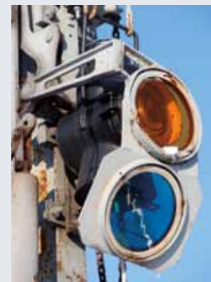
Zasłony na tarczy ostrzegawczej PFS