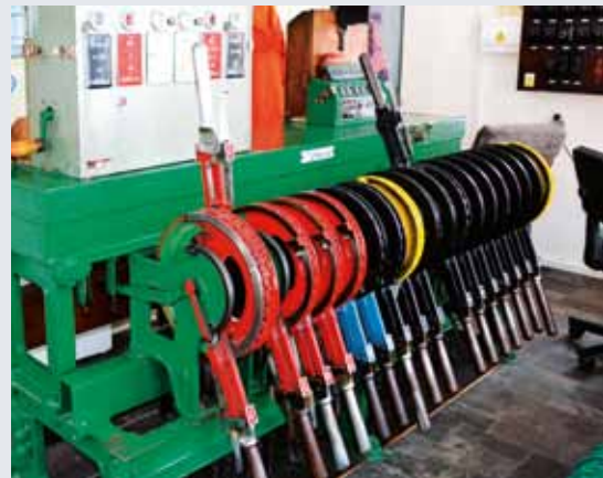
Urządzenie zwrtnicze na zwrtnicy St1

Stacja dysponuje pięcioma torami transportowymi i sześcioma torami manipulacyjnymi z czternastoma centralnie i pięcioma ręcznie nastawianymi. Na roztockiej /jilemnickiejm zwrtnicy znajduje się przejazd kolejowy z mechanicznym zabezpieczeniem przejazdowym i przedzwonieniem Trójlistek, owładanym z wieży nastawczej St2. Eksploatacja jest zabezpieczana elektromechanicznym stacyjnym zabezpieczeniem 2. kategorii z mechanicznymi urządzeniami sygnałowymi. Sercem systemu jest urządzenie sterujące typu RANK, umieszczone w biurze transportowym w budynku ekspedycyjnym. Zestaw ze skrzyniowym blokiem początkowym, spoczywającym na urządzeniu zamykającym i włączającym z deską poziomą, na której jest umieszczony kolejowy relief stacji. Urządzenie obsługiwane przez zawiadowcę stacji, jest połączone kablami z dwoma urządzeniami zwrtnicznymi typu 5007 na zwrtnicach obsługiwanych sygnalistami. Urządzenie zwrtnicze St2 jest oprócz tego wyposażone owładaniem szlabanów za pośrednictwem skrzyni przewodowej z korbą.