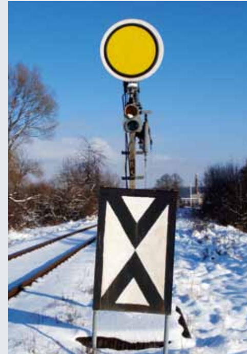
Tarcza ostrzegawcza PFS w pozycji Ostrzeżenie