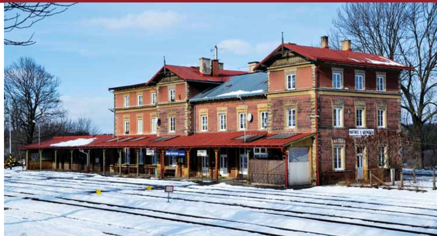
Widok na budynek ekspedycyjny od strony torów, z lewej strony przybudówka kolei miejscowej do Rokytnicy nad Jizerou

Wprowadzono do eksploatacji obecne elektromechaniczne urządzenie zabezpieczające stację