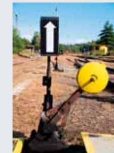
Semafor zwrtniczy w pozycji Jazda w kierunku bezpośrednim

Ilość stacji kolejowych wyposażonych semaforami mechanicznymi maleje z roku na rok wraz z postępującą modernizacją sieci kolejowych w Republice Czeskiej. Jest widoczne, że kwestią kilku lat będzie ich zupełny zanik. Usiłowania Państwowego Konserwatora Zabytków idą w kierunku zachowania przynajmniej jednej stacji w naszej sieci kolejowej, która jest zgodna z obowiązującą legislacją i przepisami transportowymi. Dziesiątki lat funkcjonujący system zostałby nadal i mógłby przynieść radość i pouczenie dalszym generacjom. Można się domyśleć, że takim miejscem mogłyby być właśnie Martinice v Krkonoších.