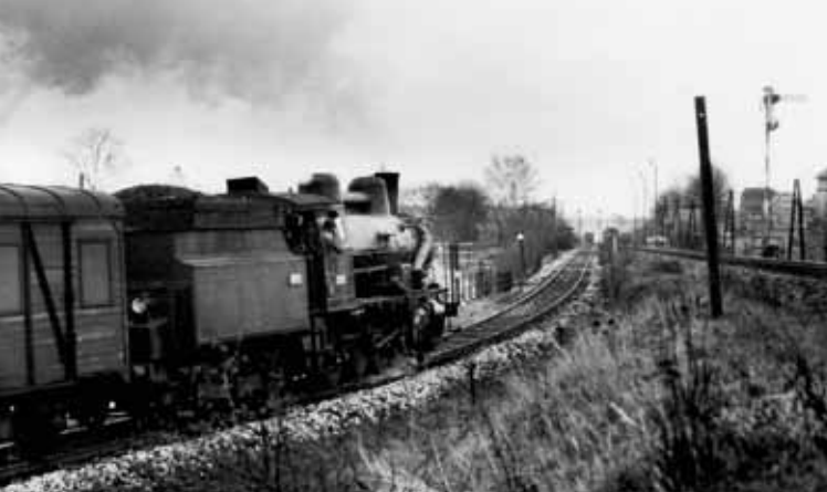
Lokomotywa 434.2175 wjeżdżająca na stację z Rokytnicy w 1977r

Stacja kolejowa Martinic v Krkonoších prezentuje unikatowy sareał w ramach Republiki Czeskiej, dokumentujący w wyjątkowej całości system zarządzania i zabezpieczenie ruchu kolejowego w ciągu XX wieku. Jej najbardziej charakterystycznym znakiem są semafony mechaniczne, jednak obraz historyczny stacji odtwarza również żuraw wodny, jama popiołowa, słupy oświetleniowe, zawory mechaniczne, a także budowle, przede wszystkim budynek ekspedycyjny, wieża ciśnieniowa, parowozownia, magazyn, posterunek dróżnika i oba posterunki zwrotnicze. Zachowane obiekty i urządzenia pochodzą z lat 1871–1948, i reprezentują transport kolejowy w szczytowym okresie jego rozwoju. Sama budowa trasy kolejowej z Velkiego Oseka do Trutnova-Poříčí, na której znajduje się stacja, przypada na okres budowlanej gorączki kolejowej na początku lat siedemdziesiątych XIX wieku, kiedy to budową znaczących ogólnokrajowych tras zajmowały się mocne prywatne spółki kolejowe. Do tych największych należała Austriacka Kolej Północno – Zachodnia, mająca wybitną pozycję właśnie na Podgórzu Karkonoskim. Budowa trasy łączącej do Rokytnicy nad Jizerou, która rozpoczyna się w Martinicach, pochodzi z okresu budowania kolei miejscowych na przełomie XIX i XX wieku, kiedy to inicjatorami tych inwestycji były samorządy, arystokracja a przede wszystkim miejscowi fabrykanci. Wartość zabytkową areału wyraźnie zwiększa fakt, że urządzenie zabezpieczające stację nadal funkcjonuje.